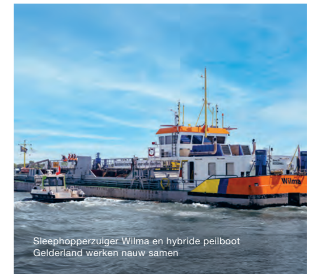
Sleehopperzuiger Wilma en hybride peilboot Gelderland werken nauw samen