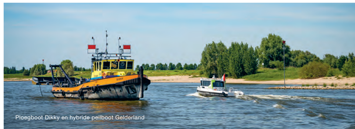
Ploegboot Dikky en hybride peilboot Gelderland

“Bij het baggeren kijken we kritisch naar de beste werkwijze om hinder voor de scheepvaart zoveel mogelijk te voorkomen. Het baggerwerk bij Sint-Andries proberen we bijvoorbeeld te combineren met een toch al noodzakelijke buitendienststelling voor onderhoud van de sluiskolk. Daarnaast verzamelen we informatie om de baggerstrategie te kunnen optimaliseren, waarbij we steeds meer aan voorspelbaarheid werken en onze ingrepen minimaliseren. Met onze hybride peilboot Gelderland winnen we data (multibeam-peilingen) in die bijdragen aan de voorspelbaarheid. Door slim samen te werken met de natuur en de kracht van de rivier juist in ons voordeel te gebruiken, optimaliseren we onze aanpak met als resultaat: slim, duurzaam en veilig onderhoud.”